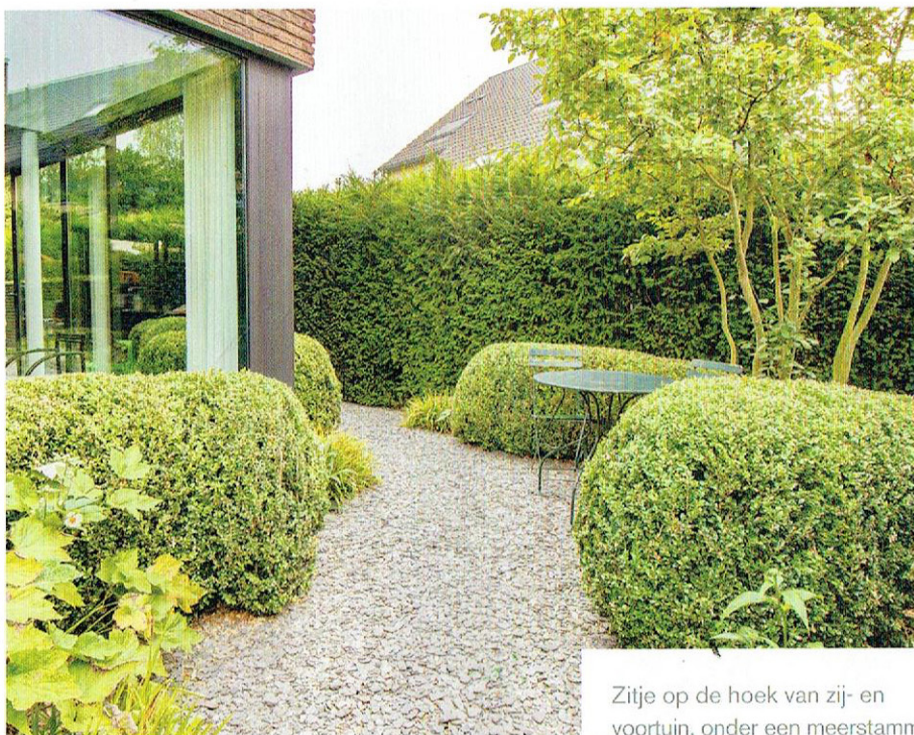
Zitje op de hoek van zij- en voortuin, onder een meerstammig krentenboompje.

Naast het hoofdterras staat een kloeke houten bergkast voor fietsen, tuinmaterialen, barbecue, et cetera. De bovenkant werd verfraaid met een ►