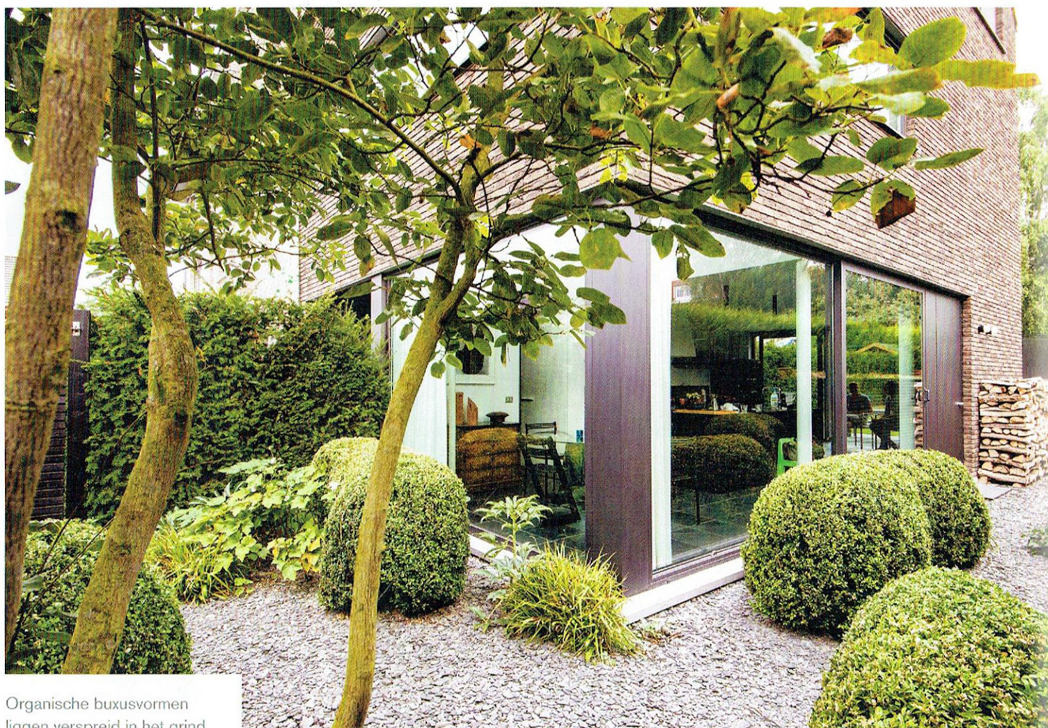
Organische buxusvormen liggen verspreid in het grind van leisteen.

Tekst Hanneke Louwerse