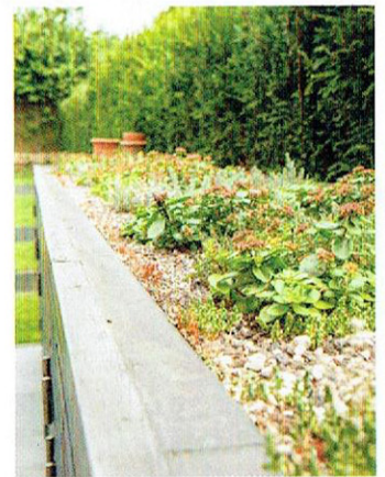
Een plantendak verfraait de bergkast.

DE VLOER VAN HET INTERIEUR LOOPT NAADLOOS OVER IN HET TERRAS; ZO WORDEN BINNEN EN BUITEN VERBONDEN