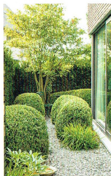
Het krentenboompje en de vaste planten brengen beweging en markeren de wisseling van seizoenen.