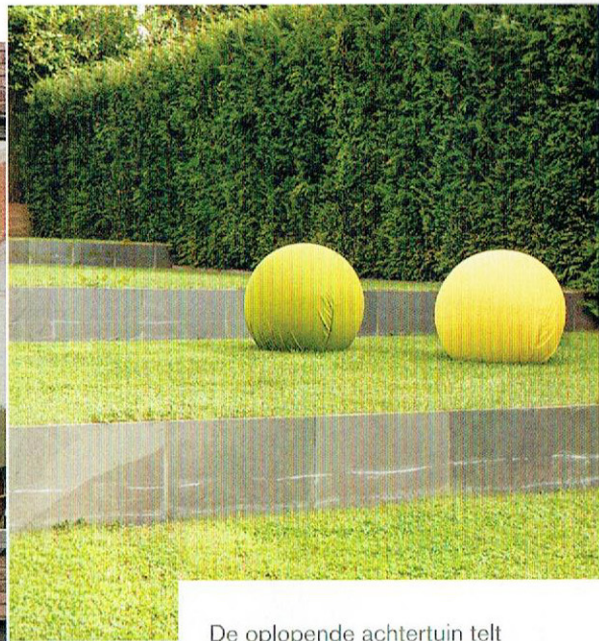
De oplopende achtertuin telt vier traptreden, met fronten van leisteentegels.