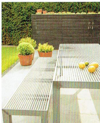
Strak stalen meubilair op het hoofdterras.

dakje van vetplanten en Sedum ; ze wortelen in lichtgewicht lavasubstraat. Een slim idee! Vanaf de bovenverdieping lijkt het op een bordertje. Op de begane grond kun je de plantjes op ooghoogte bewonderen.